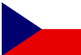
the Czech republic